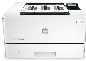
HP LaserJet Pro M402dn

Printprestaties en solide beveiliging voor uw manier van werken. Deze competente printer voert taken sneller uit en biedt uitgebreide bescherming tegen bedreigingen. 1 Originele HP tonercartridges met JetIntelligence produceren meer pagina's. 2