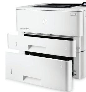
HP LaserJet Pro M402dn met optionele lade voor 550 vel